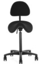
SADDLE SEAT | 26