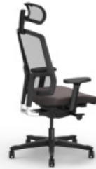
ONE | 4