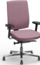
ONE | 4