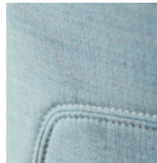
TYGER | 28