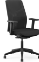
YOYO | 14