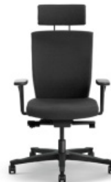
SPLICE | 18