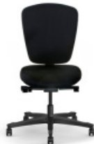
TEAMSPIRIT | 22