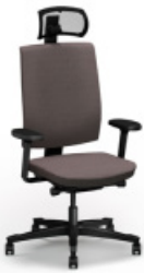
ONE | 4