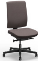
ONE | 4