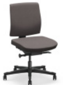
ONE | 4