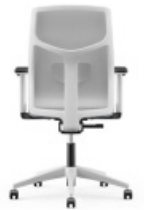
YOYO | 14