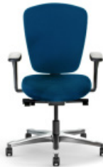
TEAMSPIRIT | 22