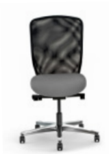
TEAMSPIRIT | 22